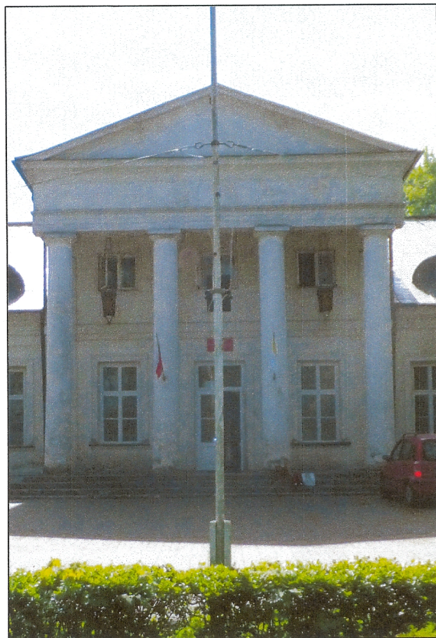
Portyk na elewacji frontowej - północnej.