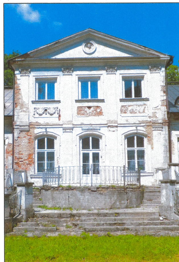
Ryzalit na elewacji południowej i taras.